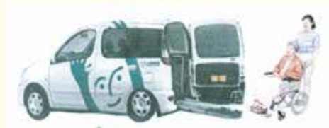
福祉車輛貸出サービスイメージ

考えています。 サービスを利用する人も提供する人も同じ地域に住む住民同士、みんなで互いに助け合っているという趣旨で行っている地域福祉活動です。 また、家族等の介護の経済的負担を軽減し、日常生活の便宜を図ると共に、介護を必要とする者等の社会参加の促進を図り、障害者及び高齢者の地域福祉活動の推進に寄与することを目的として、福祉車輛貸出サービスを行っています。